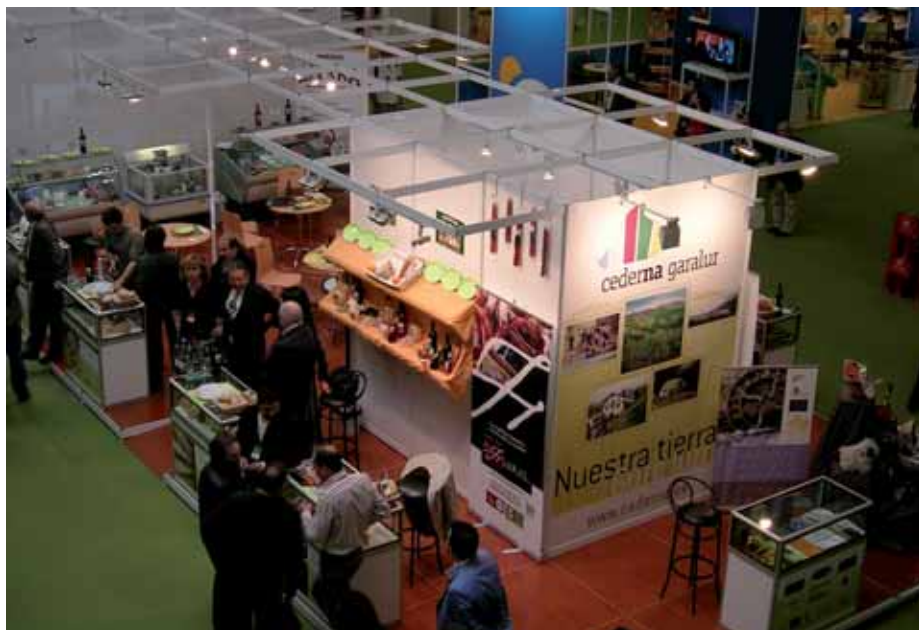
Ciudad Realen antolatzen zen 'España Original' azokan Cederna Garalur Elkarteak paratu zuen standaren goitiko bista.

Programaren finantza zuzkidura 9.017.375 euro izan zen; kopuru horretatik, 4.959.556 euro Landa Garapenerako Europako Nekazaritza Funtsetik (LGENF) dator, eta 4.057.819 euro Nafarroako Gobernutik. Finantza zuzkidura hori ekarpen publiko eta pribatuekin osatuko da. Gaur egun 4.209.775,36 euro daude konprometiturik; kopuru horretatik, 1.686.528,02 euro exekutatu dira 2010eko abenduaren 31ko datarekin. Horrenbestez, aise betetzen ari dira programan ezarrita zeuden itzaropenak.