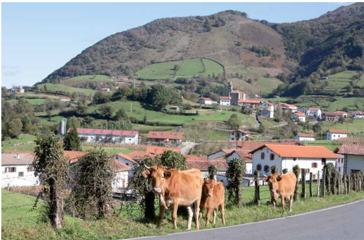
Nekazaritza eta abeltzaintza sektoreak hainbat proiekturen onura jaso du.

Turismoa, ondarea eta kultura, ETEak, informazioaren eta komunikazioaren teknologiak, inguru-mena, nekazaritza eta abeltzaintza... Nafarroako Mendialdeko sektore eta arlo horiek ‘Nafarroako Mendialdea’ Landa Garapeneko Programaren onurak jasotzen ari dira. Programa Cederna Garalur Elkartek kudeatzen du, eta Landa Garapenerako Europako Nekazaritza Funtzaren (LGENF) eta Nafarroako Gobernuaren finantziazioa du, baita tokian tokikoa eta proiektuen sustatzaileek berek egindako ekarpenak ere.