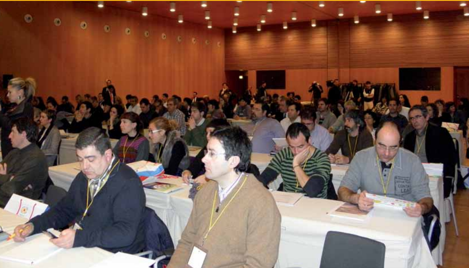
Nafarroan, Baluartean, antolatutako Landa Turismoaren inguruko II. Kongresuko partaideak.

Nafarroan antolatu da landa-turismoari buruzko II. kongresu hori. Cederna Garalur Elkarteak kongresuan parte hartu du bi mahai-inguru koordinatzen, batetik, zaldi turismoa eta, bestetik, bileren turismoa aztergai izan dituztenak.