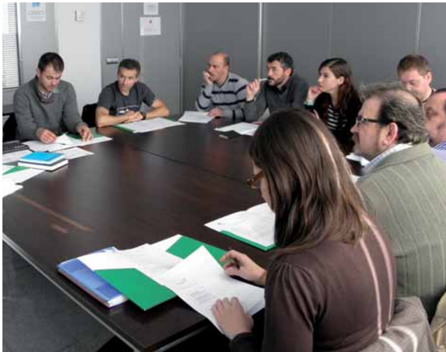
Zortzi enpresek jasoko duten prestakuntza prozesuaren aurkezpena.

Ekimen berri honetan parte hartzen hasi diren enpresen aukeraketa urteko lehen hilabeteetan egin da. Ekintzari oso harrera ona egin diote enpresek, eta bukatutakoan enpresa bakoitzak bere marketin 'on line' plana ezarrita edukitzea espero da.