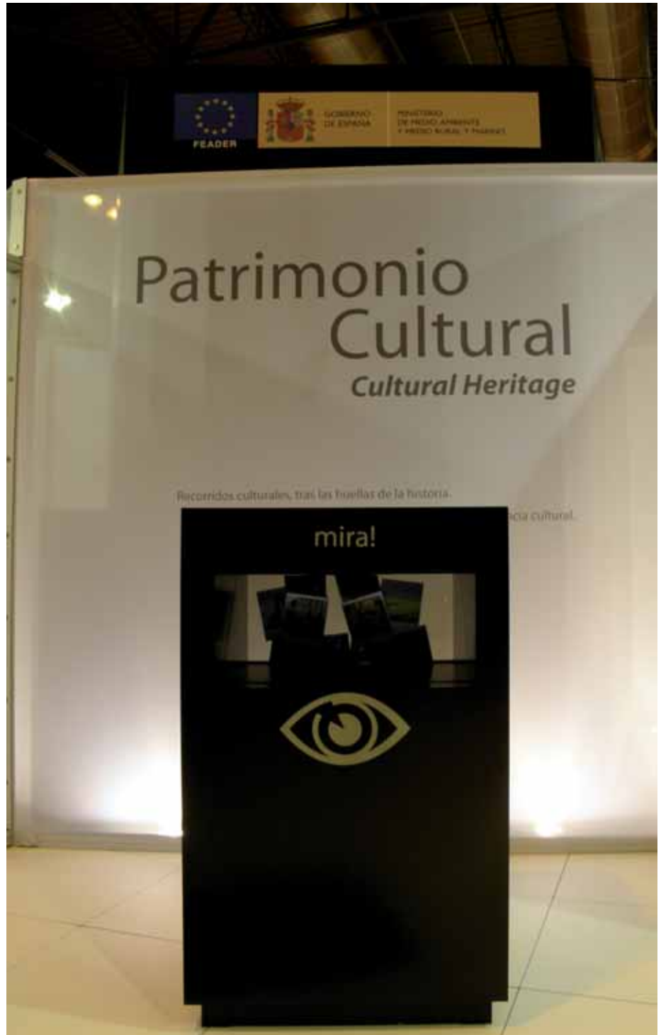
Europa erromanikoaren standa

“Europa erromanikoa” proiektu horietako bat da, kultur ondarearen arloan txertatua. Lan ildo estrategiko horren barnean txertatzen den beste proiektu bat “Reto Natura 2000” da.