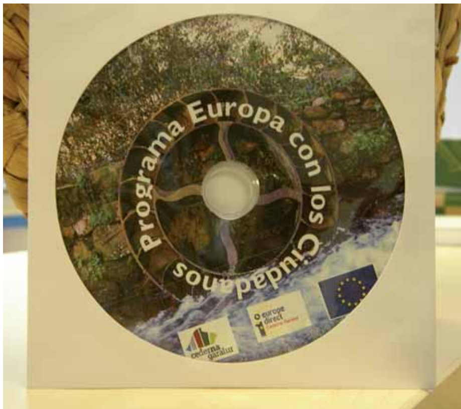
Senidetzeetara bideratutako web europarraren irudia

EDO 948 20 70 59 TELÉFONO-ZENBAKIRA DEITUTA