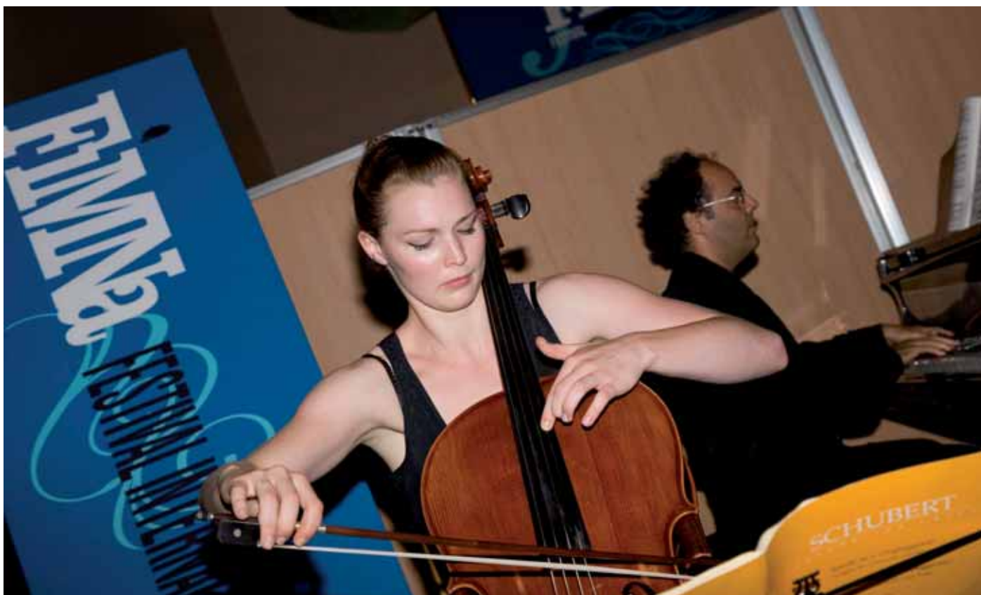
'FINMA, Musika Jaialdia', programak sostengatua eta Eugin burutua

Garapen ekonomikoa ekarriko duten proiektuei sostengua ematen lan egiten ari da