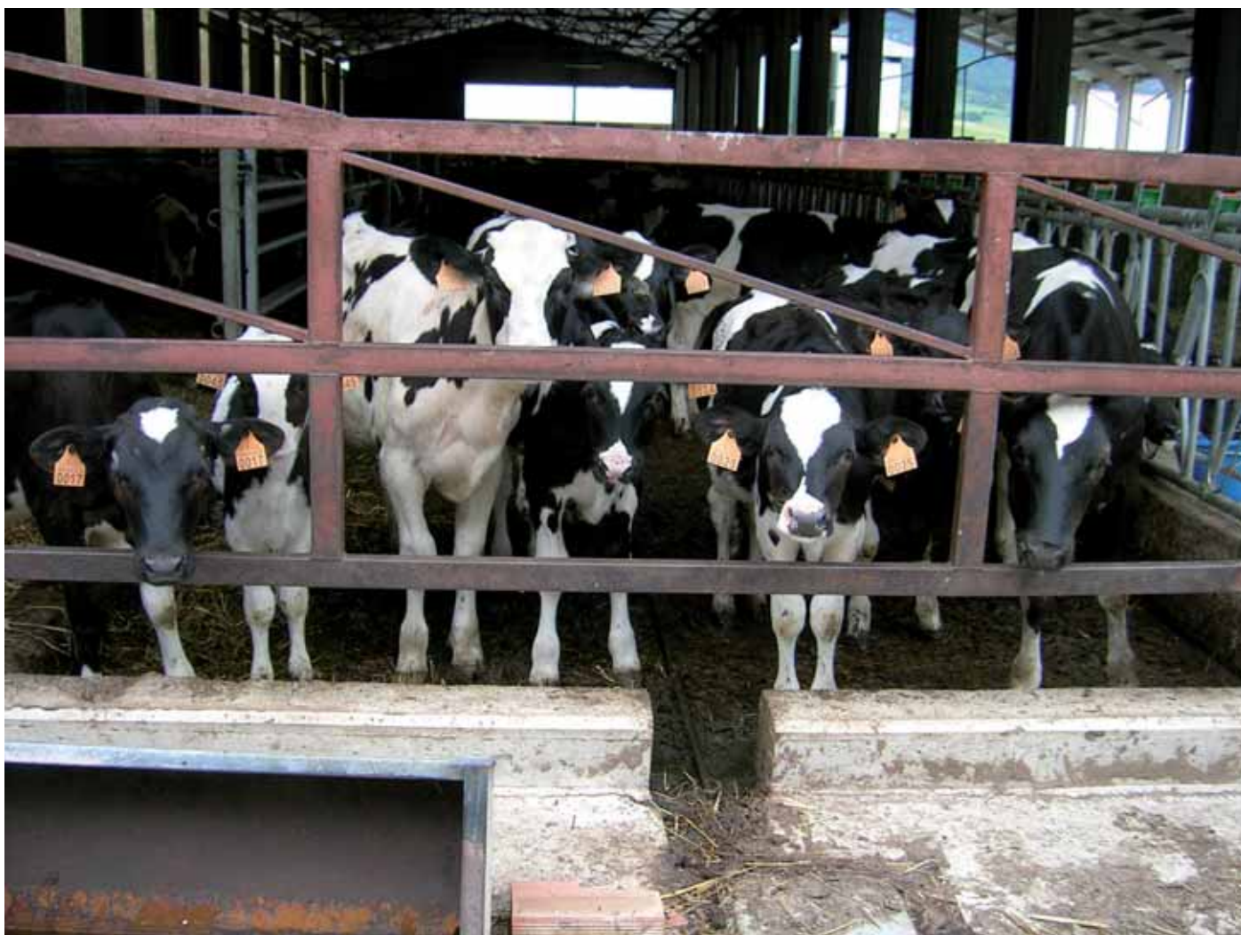
Etxeberri ganadutegiko instalazioak, Arakilen

Esnearen interpretazio-zentroa Ustiapeneko instalazioak zabaltzearen eta hobetzearen barnean, esnearen in-