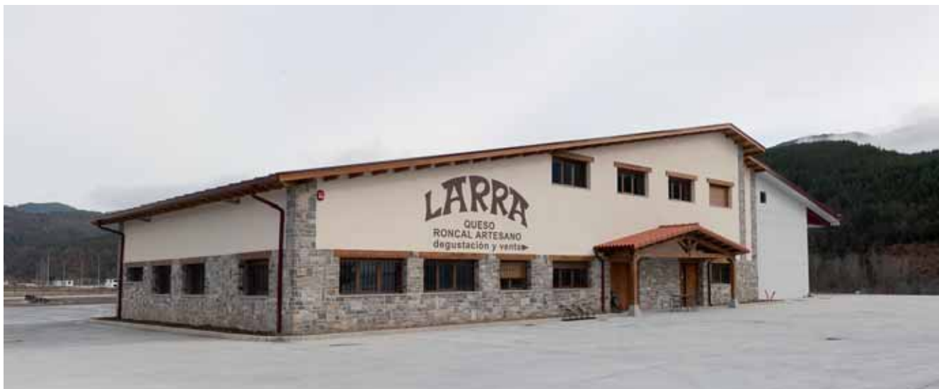
'Quesos Larra' enpresaren fabrika berria Erronkariko (Burgi) enpresa parkean

netatik egiten dugu, beti harmonian, oso giro ona dugu.