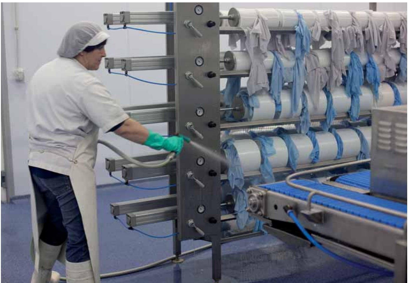
Makinak garbitzeko lanetan