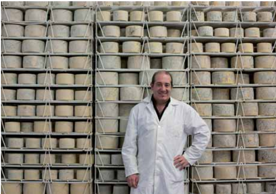
Enpresako ganberetako baten itxura