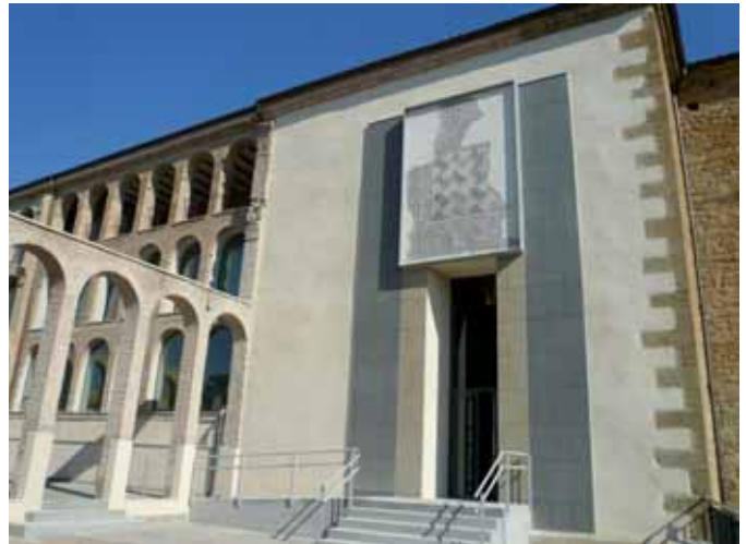
Bileren turismoa Nafarroako Mendialdean