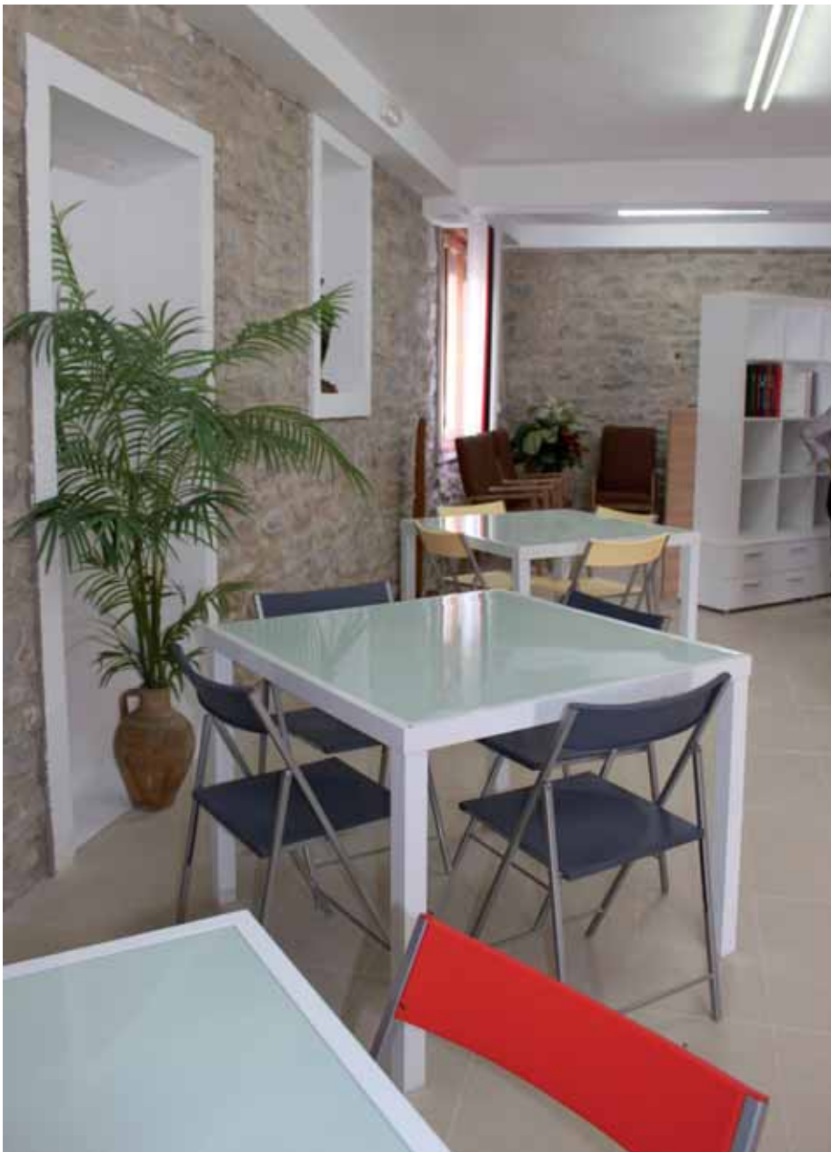
Ledeako Gizarte eta Kultur Etxeko altzariak

Herriak ekintzen onurak jasotzen ari dira.